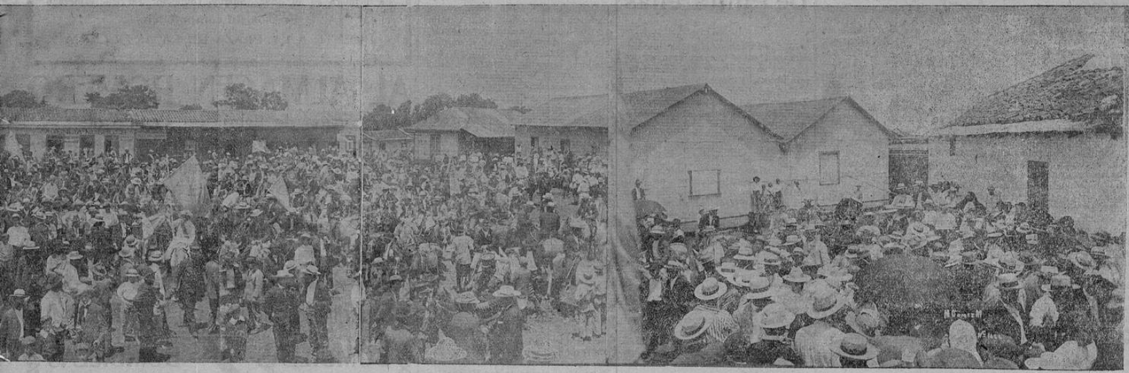
FRANTE EL MEETING REPUBLICANO DEL DOMINGO 13 DEL PRESENTE MES